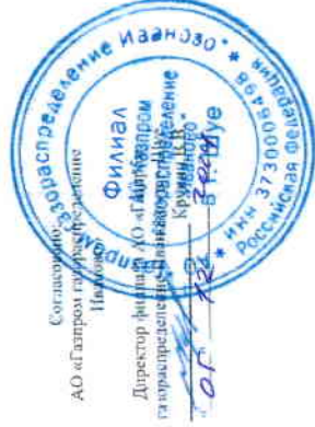
Схема газоснабжения д. Литвинцево Шуйского муниципального района